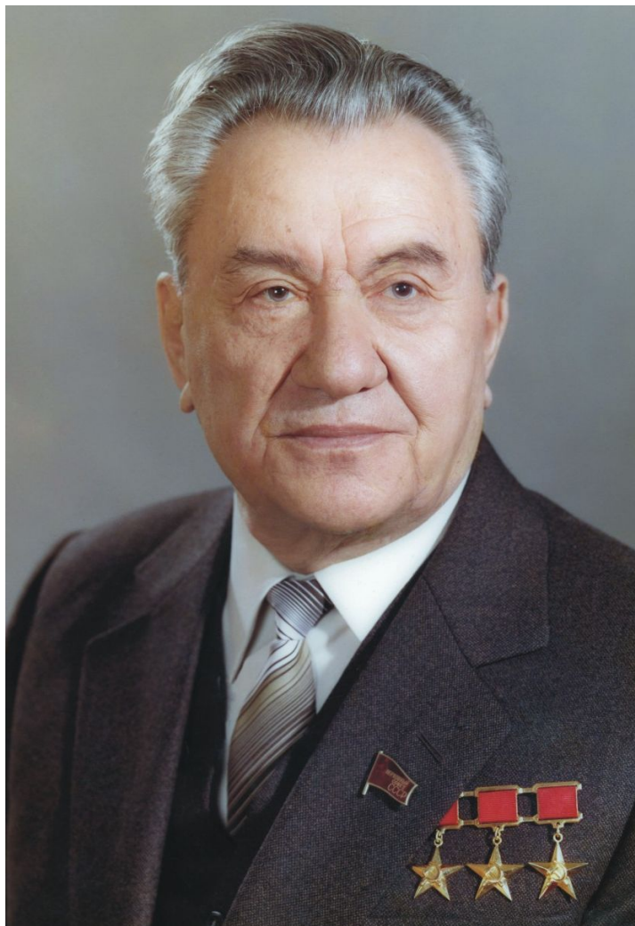
МУХИТТАН ӨТКЕН ҚАЙЫҚ